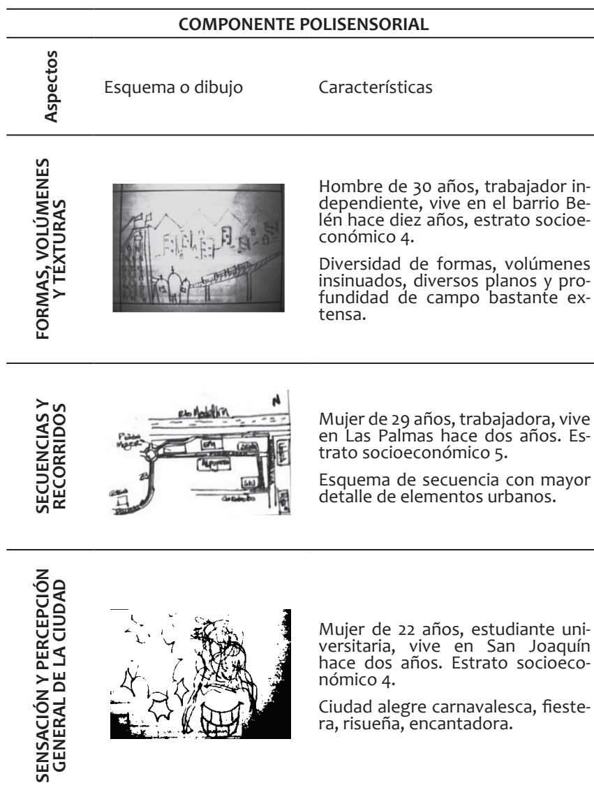
Figura 2. Muestras del componente polisensorial

El componente polisensorial también muestra la capacidad que demuestran algunas personas en la expresión gráfica, lo que permite pensar, que la representación e interpretación de la ciudad está, de cierta manera, condicionada a la facilidad o recursividad con que se cuenta para su traducción de imagen mental a representación visual.